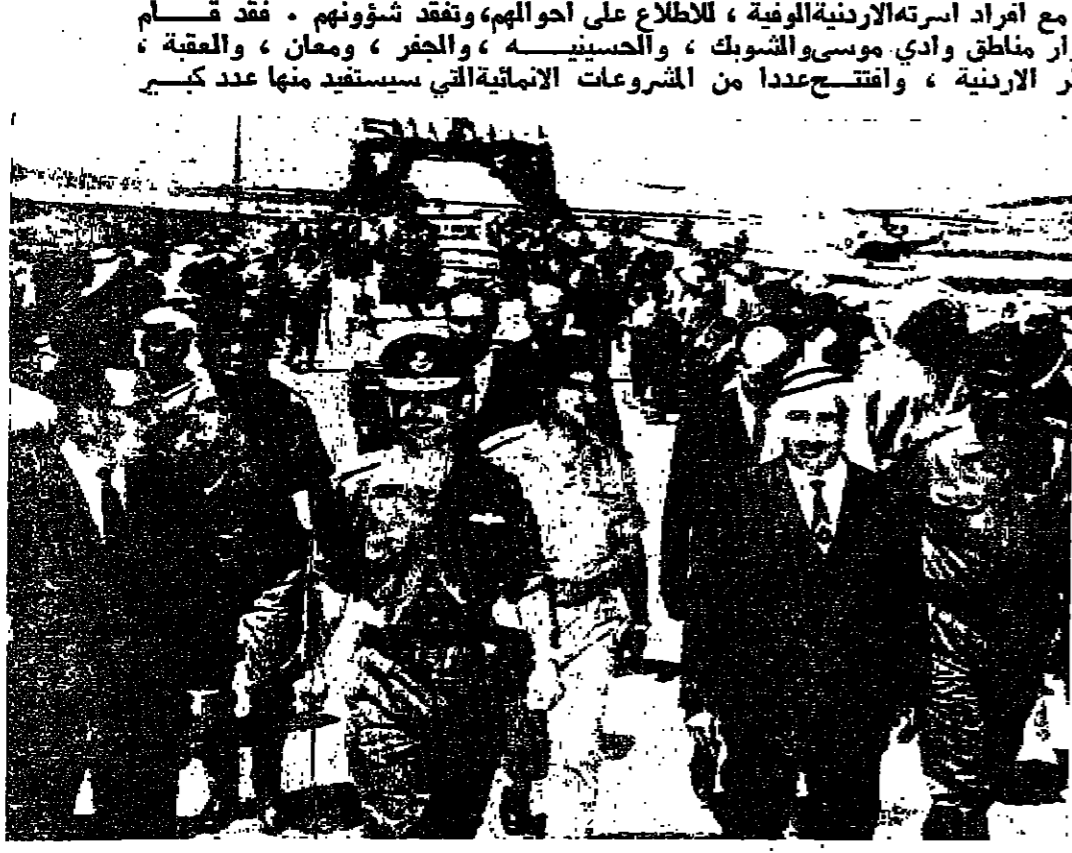
جلالة الملك العظيم وسوا ولي العهد والمعلم دولة رئيس الوزراء وكبار رجال الثورة الراقين للحسين لدى وصوله إلى مدينة الشوبك « تصوير ١.١ »

بهلاله يؤكد على أن الصبر مع القرم والصميم والثقة هي طريقنا للوصول إلى أهدافنا